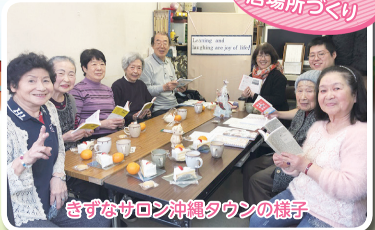
きずなサロン沖縄タウンの様子