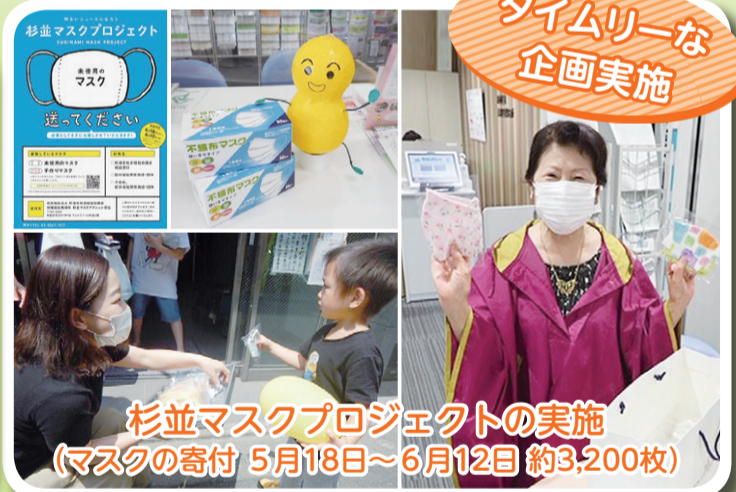
杉並マスクプロジェクトの実施 (マスクの寄付 5月18日~6月12日 約3,200枚)