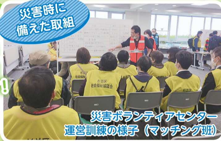
災害ボランティアセンター 運営訓練の様子(マッチング班)